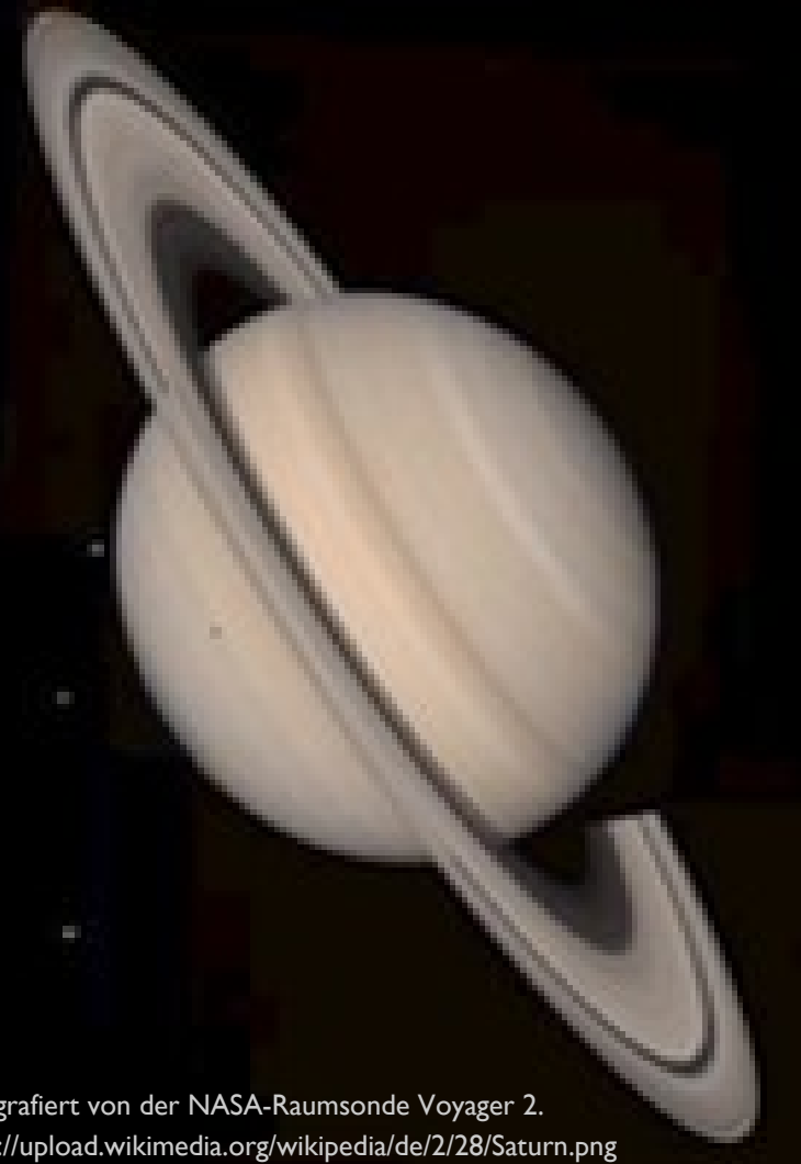
Saturn, fotografiert von der NASA-Raumsonde Voyager 2. Quelle: http://upload.wikimedia.org/wikipedia/de/2/28/Saturn.png